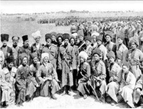
Resim 1. Çerkesler sınır dışı edilirken (1864)

Bu araştırma, XIX. Yüzyılın sonlarından buyana Türkiye siyasal hayatının bir parçası olan Çerkeslerin siyasal katılımlarını belirleyen faktörler ile sahip oldukları kimlikle siyasete katılmalarının hoş görülüp görülmediğine ilişkin bir takım çıkarımlarda bulunmaktadır. Çalışma, önce Çerkesler tarafından dile getirilen siyasal ve kültürel talepleri irdelerken devlet tarafından şimdiye kadar hangi taleplerinin tolere edildiğini ortaya çıkarmaya çalışmıştır.